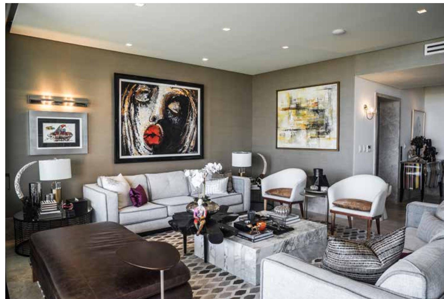
Kabeek Boutique Residencial

Estudiar la región geográfica en la que habitan sus clientes es una tarea obligada para el desarrollo de un proyecto. Conocer la flora endémica del lugar, el clima y otros elementos naturales del territorio, le permiten recrear habitaciones que convergen con los exteriores para realzar el encanto de su trabajo.