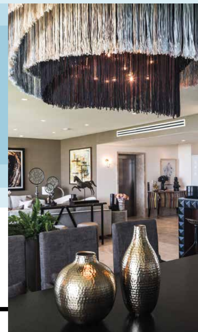
Kabeek Boutique Residencial Diseño de interiores: Bernardo Negrete Studio Ubicación: Puerto Cancún Año: 2018 Superficie construida: 293 m 2

Además de desenvolverse en el interiorismo, Bernardo Negrete maneja su propia línea de mobiliario. Sus proyectos a futuro contemplan la extensión de este negocio, la generación de nuevos productos y la implementación de un sistema de producción más eficiente. Quizá más adelante podamos encontrar su nombre en otros mercados y logremos visualizar sus proyectos en varios lugares del país. Mientras, Bernardo continúa en la búsqueda de espacios que representen un mayor desafío, que confiamos, podrá vencer e integrar a su vasta lista de éxitos. ■